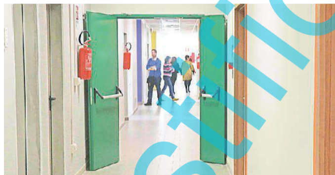
La Casa della salute che ospiterà il servizio di neuropsichiatria infantile