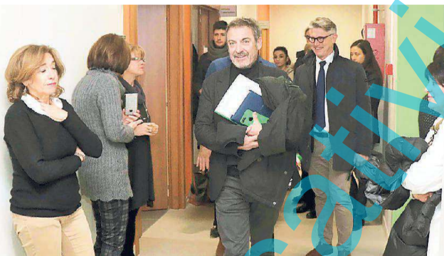
Un momento della inaugurazione ieri alla Cittadella San Rocco dell'ex Sant'Anna

«Stiamo provvedendo per spostare qui la fisioterapia e l'odontoiatria - ha annunciato - Tornando ad oggi il momento è importante poiché favori-